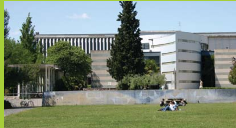
Université Montpellier 2 (UM2)

La formation se poursuit à l'Université Montpellier 2 à la 4 e session (seconde année) et le programme se termine par un essai pouvant être réalisé en milieu de travail au Québec ou en France.